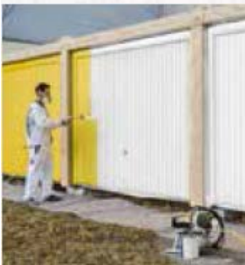
Påføring af Anti-Graffiti 24-7:

Wagner Airless pumpe PS 3.20 på bæreramme, med flex. sugesystem, 15 m. højtryksslange, Pistol AG 08 med FineFinish dyse.